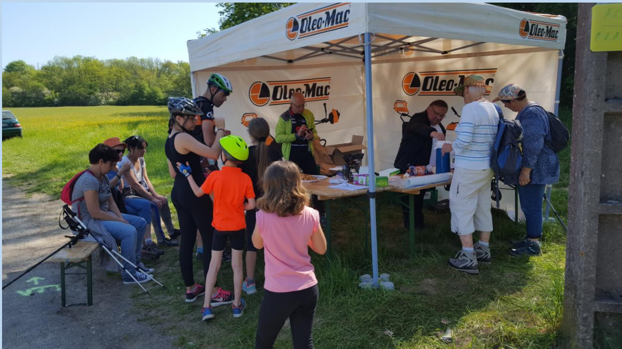
Ravitaillement aux Perches.