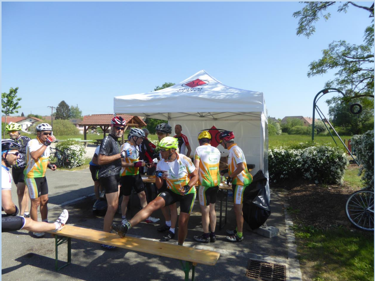
Ravitaillement à BOUROGNE